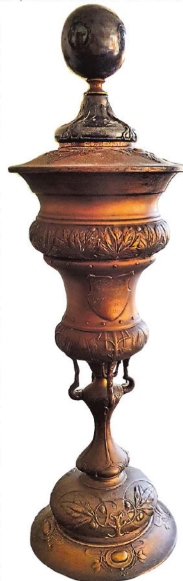
Siegpokal vom Verbandsfest Rodenkirchen im Januar 1903.