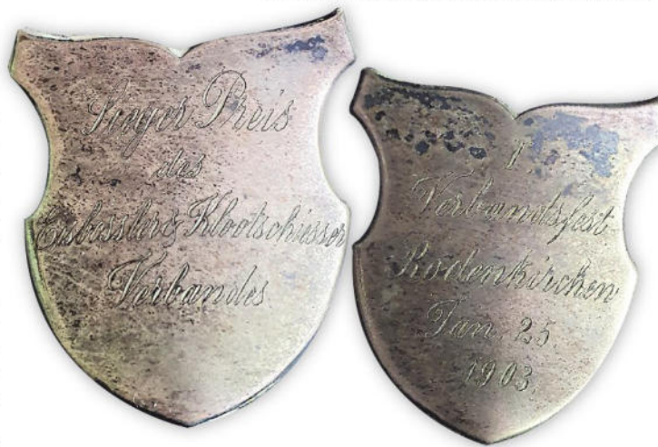
Silberplaketten des Siegerpokals vom Verbandsfest 1903 in Rodenkirchen.

Leider nahm Musterts Leben ein betrübliches Ende. In dem Artikel „Neustadtgödens, einst eine Klootschießerhochburg“ des Buches „Neustadtgödens – Lebensbeschreibungen, Ereignisse und Bilder aus 450 Jahren“ (hrsg. vom Heimatverein Gödens-Sande e.V. 1994), berichtet Dr. K. Hafemann (†): „Nach 1908 scheint die große Zeit des