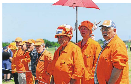
Orange war beim Hollandkugelwerfen in Pesaro am Sonnabend die dominante Farbe.

zum Schluss dicht im Nacken. Mit 1038,65 Metern sicherte sie sich Bronze. Zum ersten Mal an diesem Tag ging damit keine Goldmedaille an das Team des FKV. Den ersten Platz der Mannschaftswertung holte der NKB mit überlegenden 5825,20 Metern. Auf Position zwei landeten die Oldenburger und Ostfriesen mit 5732,79 Metern. Rang drei sicherte sich das irische Team mit 5422,55 Metern.