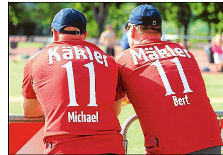
Der bestens vorbereitete Anhang unterstützte sein Sportler wo es nur ging.