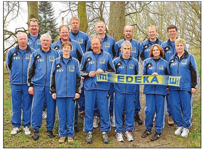
Auch für den FKV-Vorstand ist die Europameisterschaft in Pesaro keine Urlaubsreise. Auf die Offiziellen warten vielfältige Aufgaben.